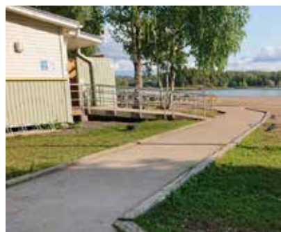
Turun Ekvallan rannalla on päällystetyt käytävät ja pyörätuolirampilla varustettu luiska veteen.

Lähteet: hagerlund.net, Lipas-liikuntapaikkatietokanta