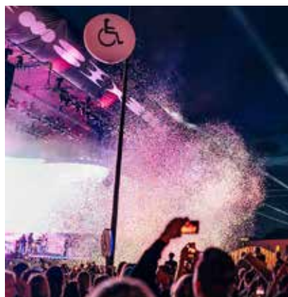
Flow Festivalin alueella on murskepintaa hankaloittamassa pyörätuolilla kulkua.