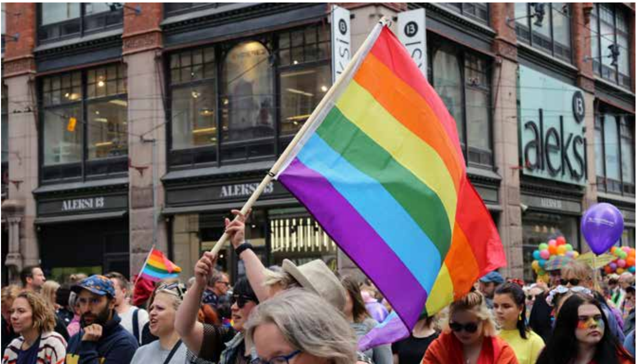
Helsinki Pride haluaa, että sen koko ohjelmakalenteri on jatkossa täysin esteetön.