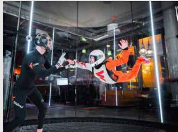
FÖÖNI / LENTOTEHDAS OY

– Silloin kouluttajalla on rauha käydä hänen kanssaan tarvittavat asiat läpi. Aloittelijat lentä-